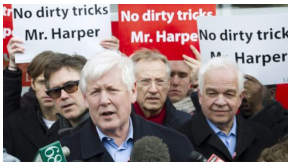
Bob Rae points finger at Conservatives

The scandal just keeps spreading and spreading